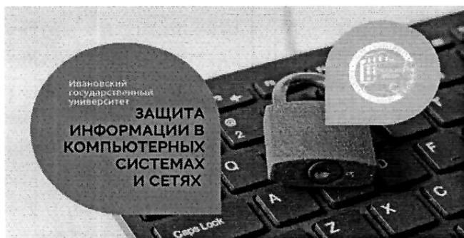
Защита информации в компьютерных системах и сетях (270 ч.)

Подробнее ознакомиться с программами и подать заявку на обучение можно на сайте https://dp.ivanovo.ac.ru/ .