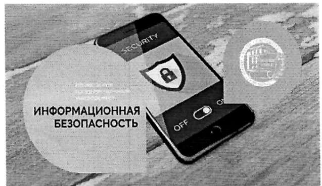
Информационная безопасность (512 ч.)