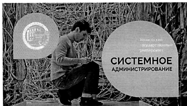
Системное администрирование (262 ч.)